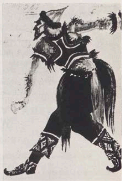
Projekty kostiumów do moskiewskiej premie- ry „Fontanny”