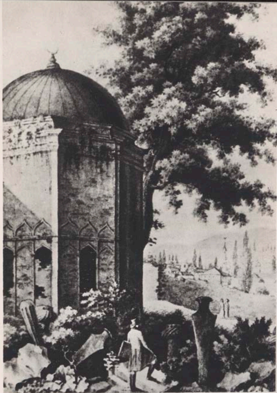
Pałac chanów w Bachczysaraju

Niedaleko pałacu chanów wznosi się mogiła w guscie wschodnim zbudowana z okrągłą kopułą. Jest powieść między pospólstwem w Krymie, że ten pomnik wystawiony był przez Kerim Giraja dla niewolnicy, którą nadzwyczajnie kochał.