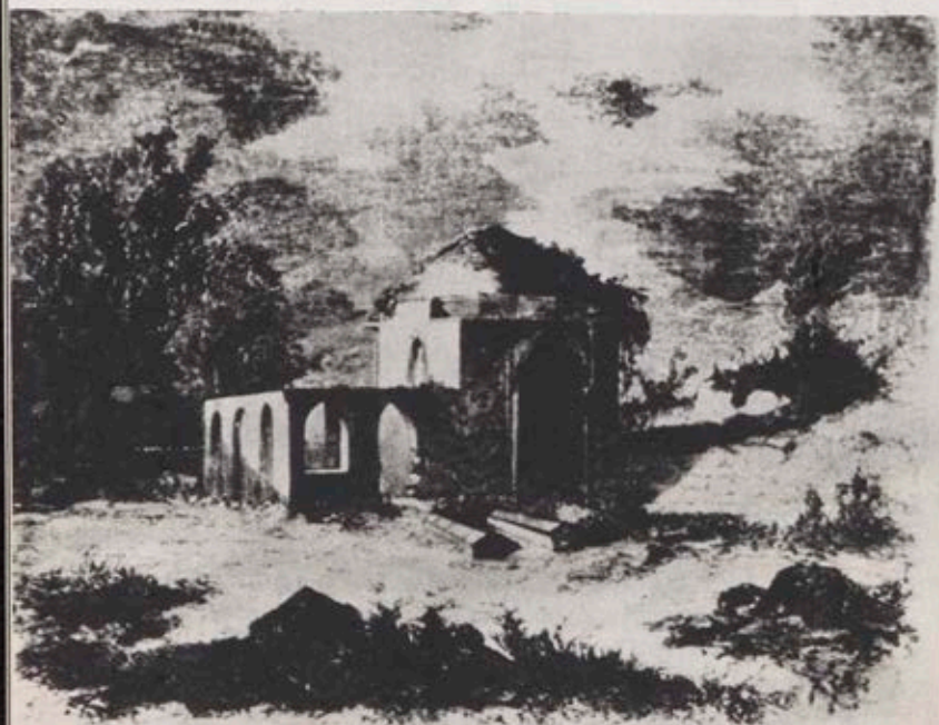
Grób Potockiej. Drzeworyt wg rys. F. Kostrzewskiego

I mnie wtenczas dźwięk mowy rodzinnej ocuci; I wieszcz samotną piosnkę dumając o tobie, Ujrzy bliską mogiłę, i dla mnie zanuci.