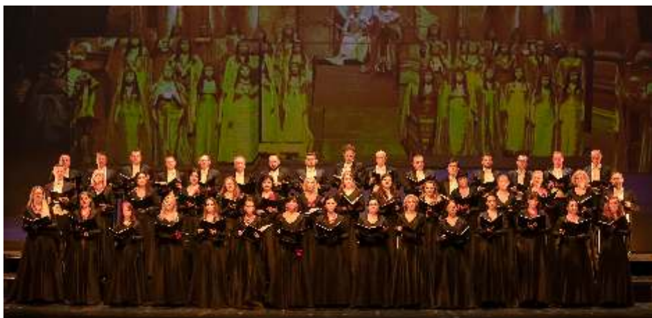
Va, pensiero. Najpiękniejsze chóry świata, 2019